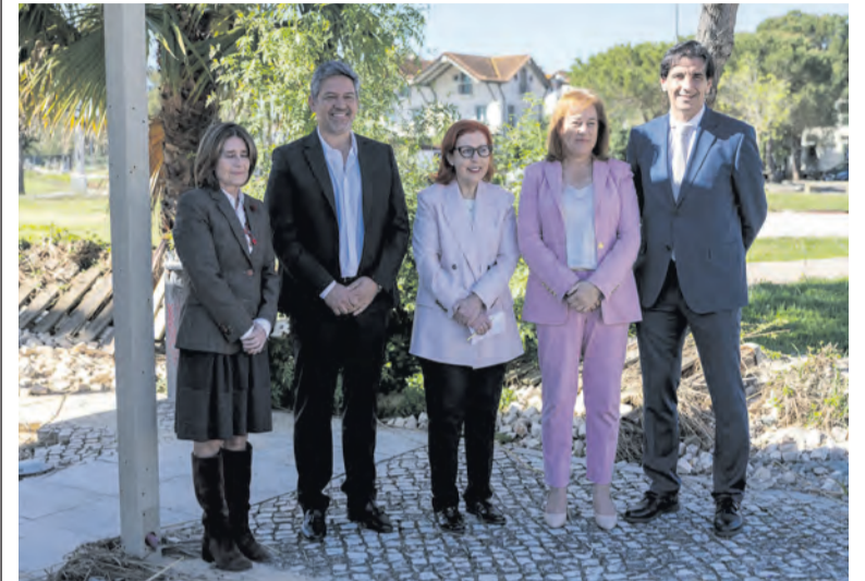
■ Ministra do Ambiente esteve presente na assinatura do contrato-programa em Alcácer do Sal

// FINANCIAMENTO DE 2,1 MILHÕES DE EUROS