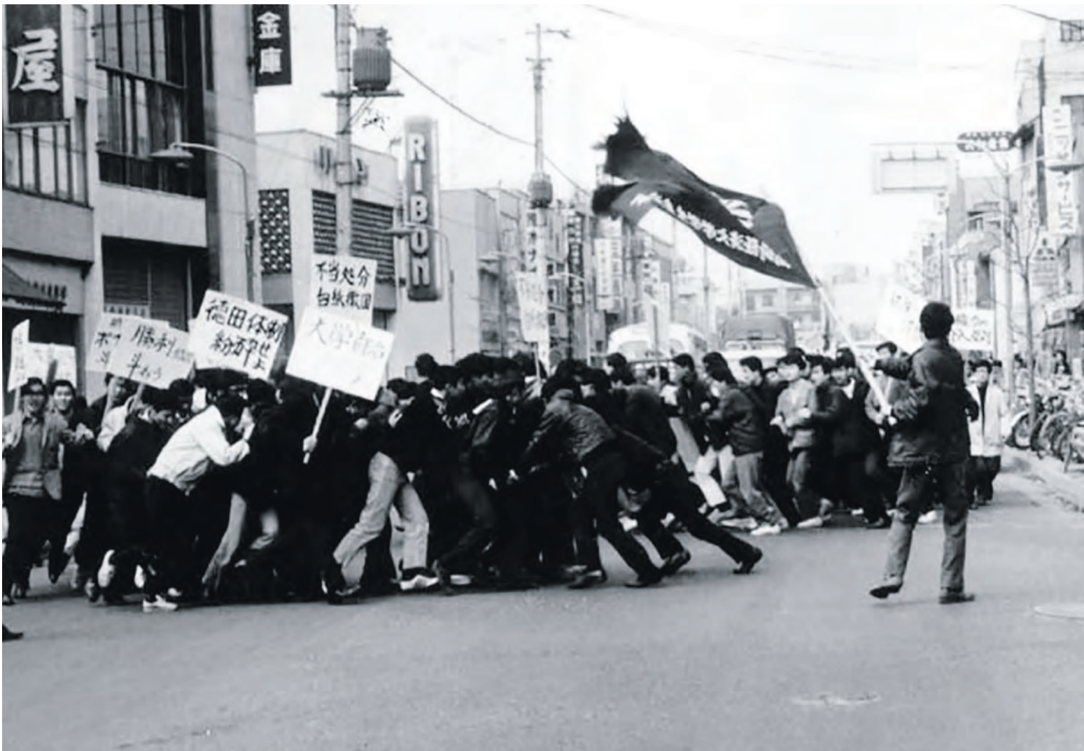
■ Trabalho do coletivo japonês Ogawa Productions vai ser um dos destaques do Doc's Kingdom em 2025