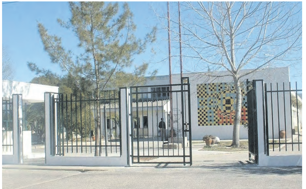
■ Escola Secundária de Odemira é uma das abrangidas pelo aviso

O financiamento das obras a realizar nestes estabelecimentos de ensino terá por base o empréstimo global celebrado entre o Estado português e o Banco Europeu de Investimento.