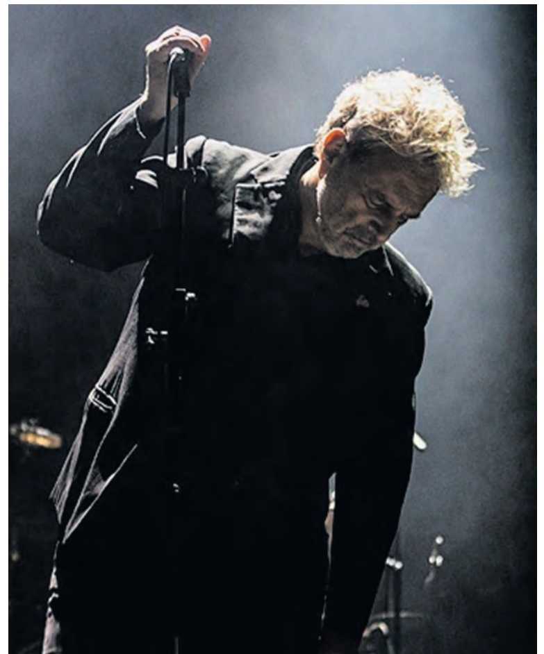
■ Vocalista dos Mão Morta vai estar em São Teotónio na noite de sábado, 8 de novembro