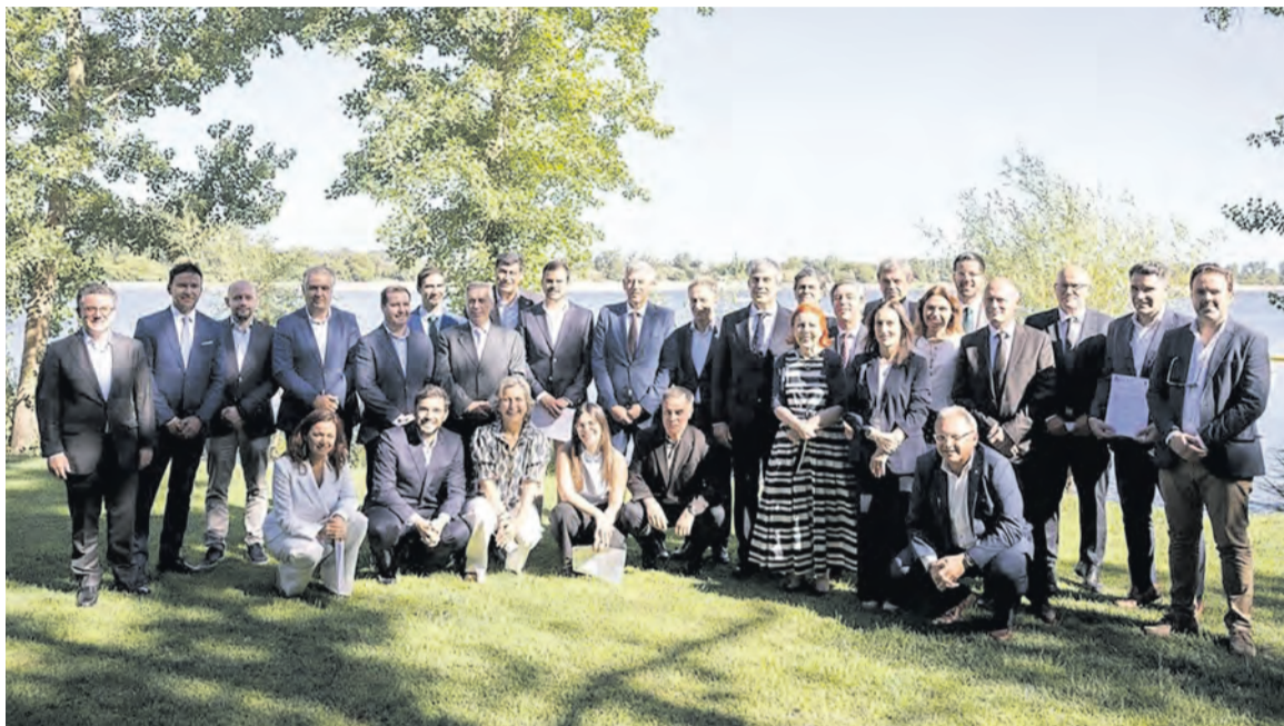
■ Cerimónia decorreu em Valada do Ribatejo, no concelho do Cartaxo

“São problemas já identificados, porque fizemos um levantamento dos estragos, tanto nas linhas de água como no litoral, mais urgen-